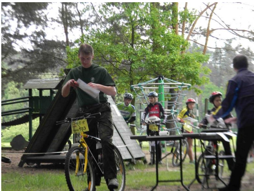
Start do zawodów w RJnO w Brynku