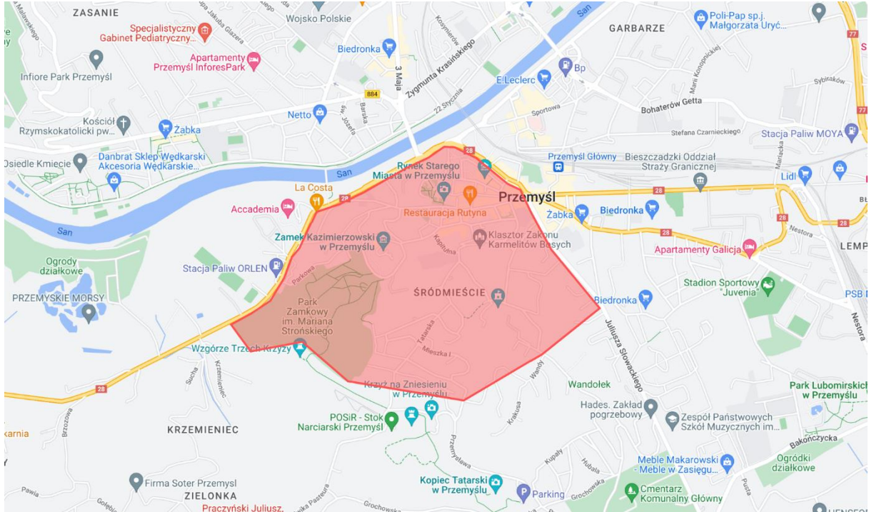
Teren zawodów – bieg sprinterski nocny