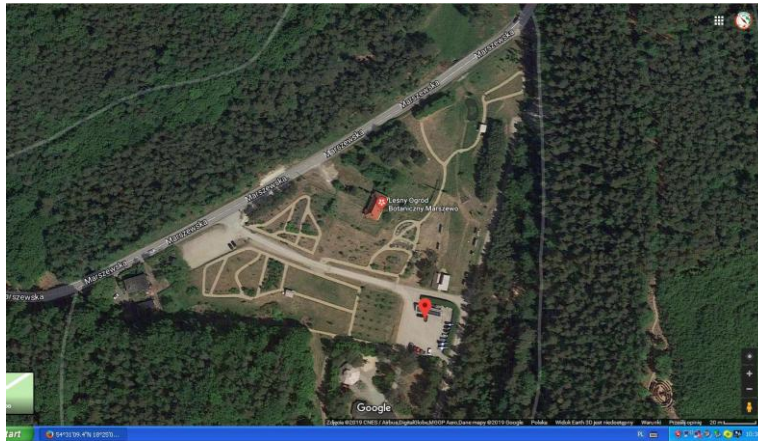
Teren Centrum Zawodów 10-11.05.2019 54°31'09.4"N 18°25'00.5"E