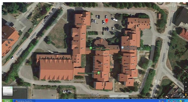
Teren Centrum Zawodów 12.05.2019 54°28'18.1"N 18°27'39.9"E